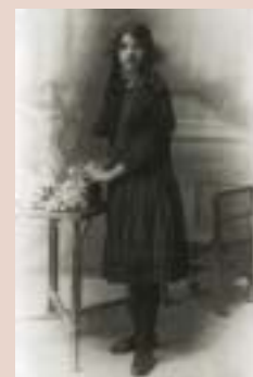
Durante el bachillerato