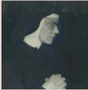
En su profesión perpetua