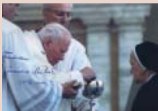
Roma, 25 de junio de 2000

25 de junio. Viaja a Roma para entregar la redacción definitiva de las Constituciones y participa en la misa de clausura del XLVII Congreso Eucarístico Internacional.