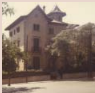
Primera casa de la Compañía en la calle Ganduxer de Barcelona

Al conocer el robo de la "Virgencita" me sentí profundamente impresionada; era una manera de arrancar a la Madre del Señor de su casa, una profanación. La imaginé situada en el salón de la casa de un coleccio-