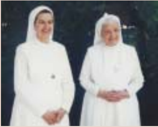
En una visita canónica a la casa de Maracaibo