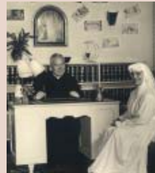
Con el Padre Peyton