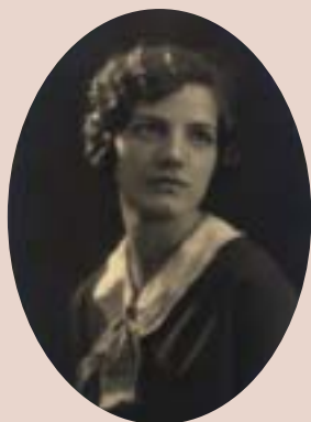
En la Universidad